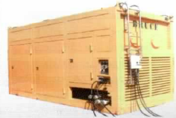
PQ-600 POWER PACK